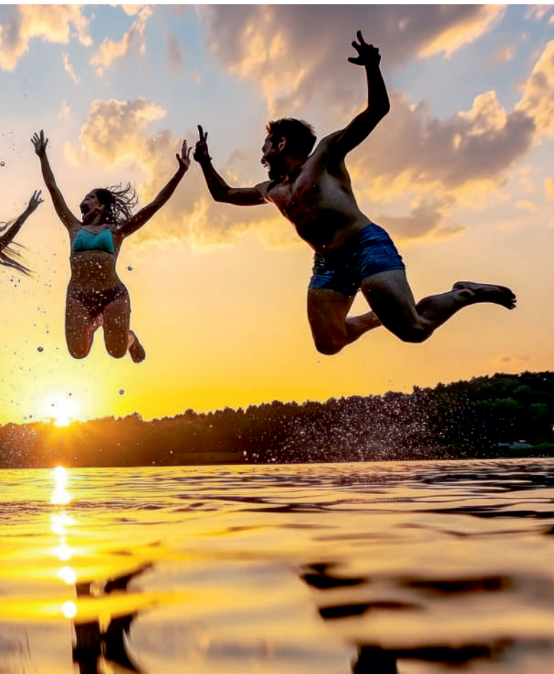
Park Wodny Tropicana